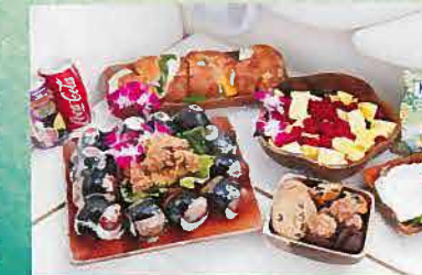
ビーチツアーで、中内でランチや軽食も楽しめる。ココアやバナナを味わおう!