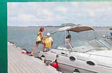
ツアーは6名まで可能。カネオヘ湾を知らずくしたスタッフが島の魅力をじっくり紹介してくれる